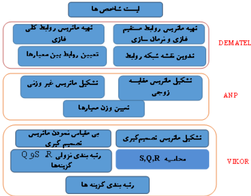
شکل ۱- فرآیند کلی روش پژوهش

در شکل (۱) به فرآیند کلی روش انجام پژوهش اشاره شده است: